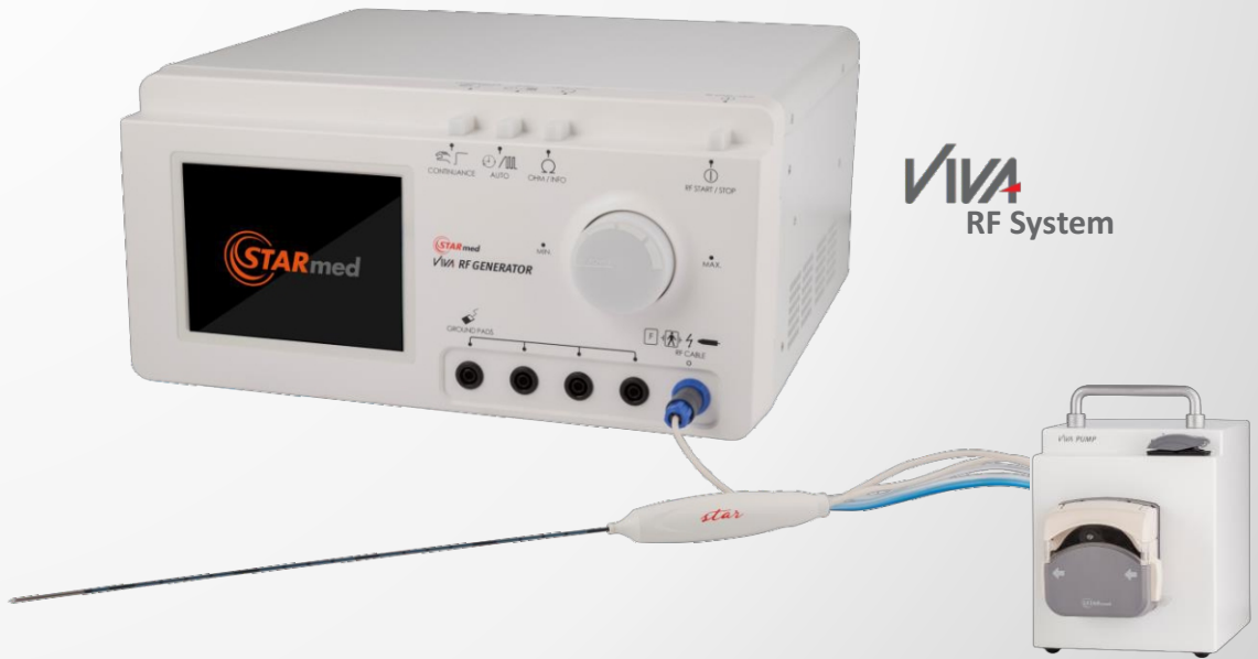
Sistema de refrigeração